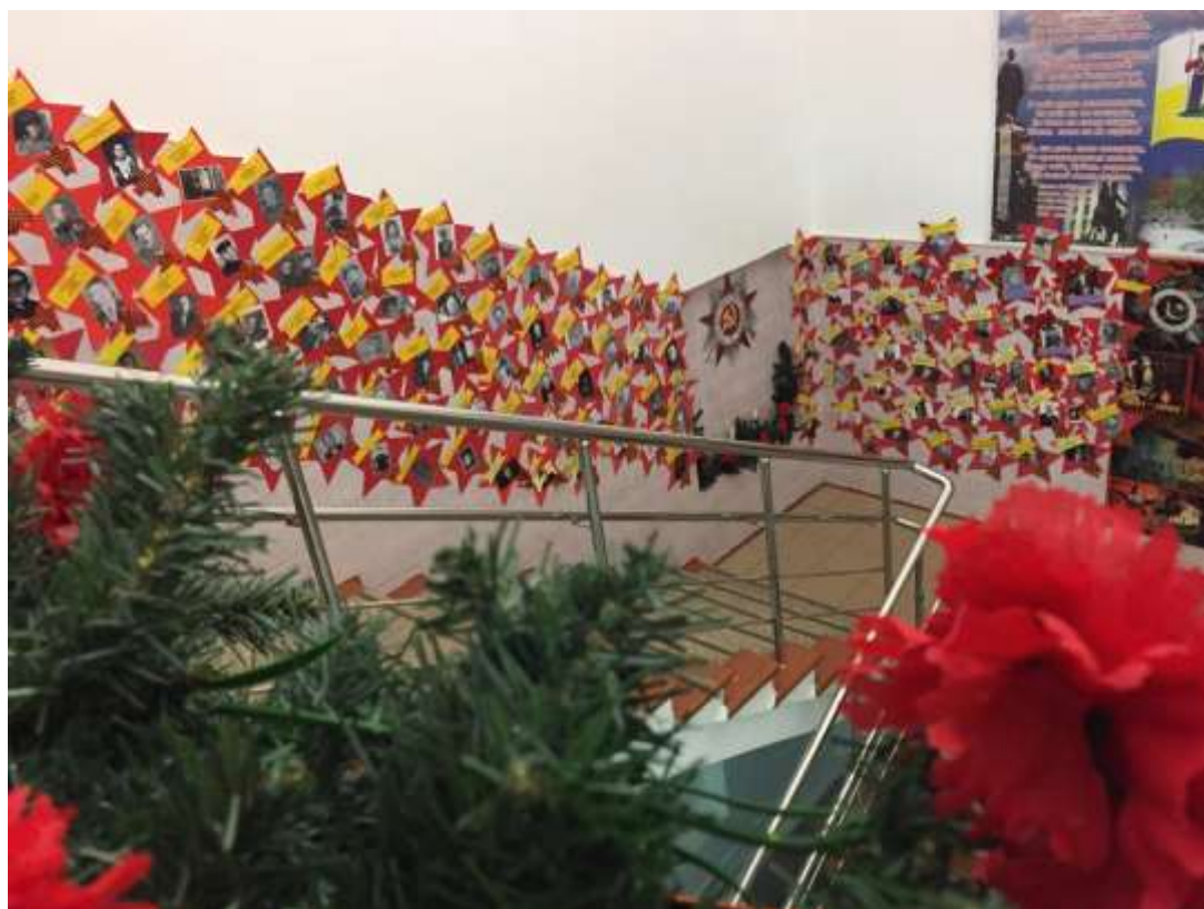
«АЛЛЕЯ ПАМЯТИ И СЛАВЫ»