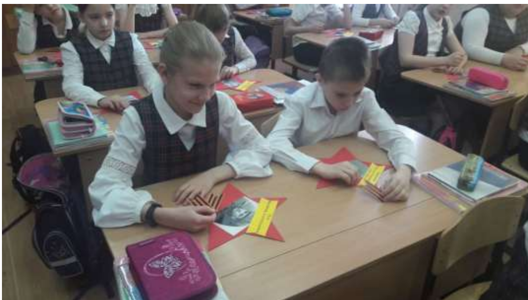
Оформление «Аллеи памяти и славы»