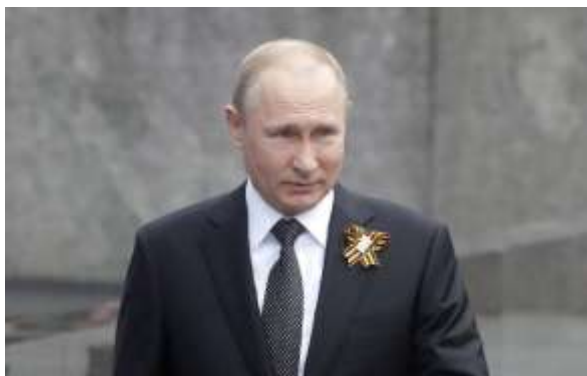
Президент РФ В. В. Путин

«Патриотическое воспитание должно стать прежде всего органичной частью жизни самого общества, только объединив усилия, мы сможем вырастить поколения, которые знают свою страну, чувствуют сопричастность её судьбе, могут последовательно отстаивать историческую правду и пресекать любые попытки оболгать, фальсифицировать прошлое, в том числе принизить решающую роль нашей страны в разгроме нацизма.»