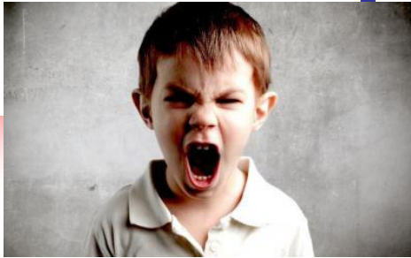
МЛАДШИЙ ШКОЛЬНИК (до 10-11 лет)